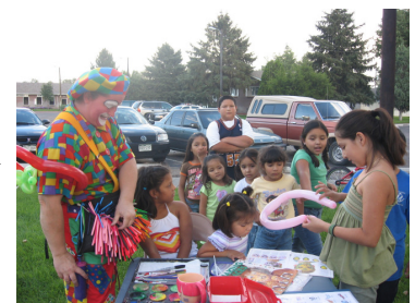
FUN activities for Kids

Por favor sea parte de nuestra asociacion de vecindarios y cooperé a planear nuevas actividades o ayude a iniciar una campana tocante a un tema apasionado para ayudar a crear un cambio positivo social en su vecindad!