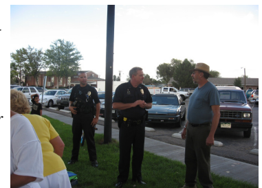
Help Build relationships